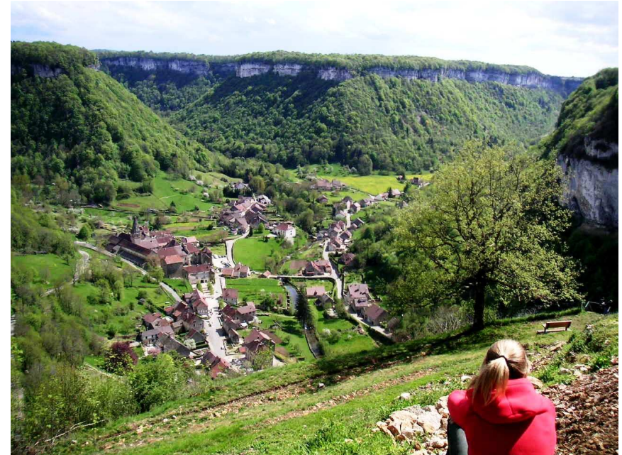
Reculée de Baume, belvédères, cascade

Point de départ : Parking des randonneurs